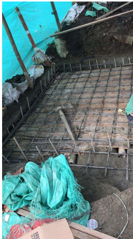
Sola superior Camaras de alcantarillado