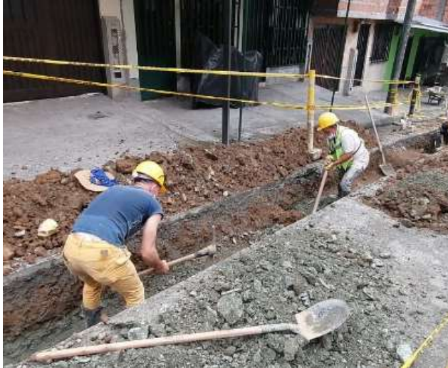
PROCESO DE EXCAVACION TRAMO N° 4 BARRIO LA GRACIELA