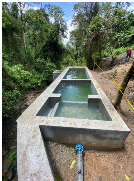
Desarenador San Joaquín