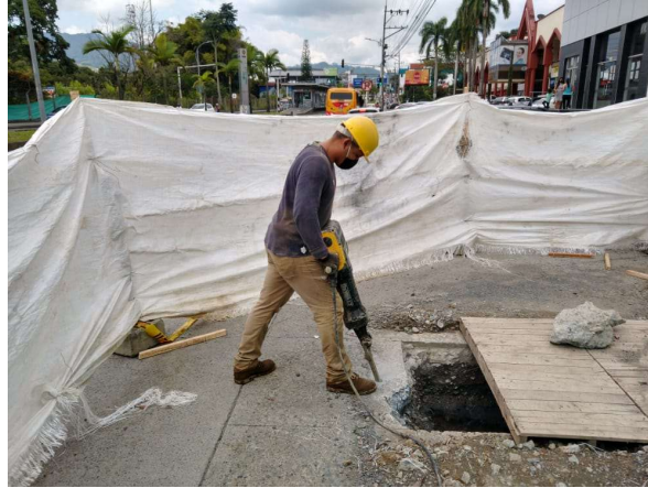
Construcción Camaras de Alcantarillado