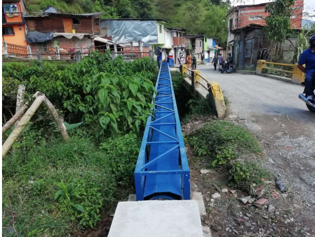
Viaducto Número 5