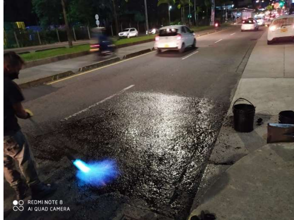
Reparqueo zonas intervenidas