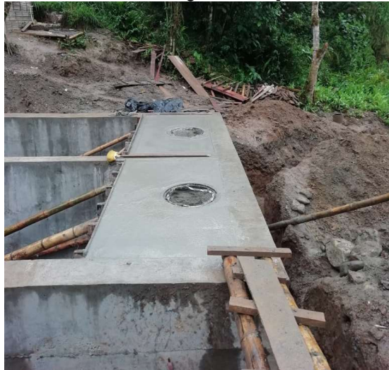
Vaciado de estructura para tapas tipo manhole [Localización:K0+100]