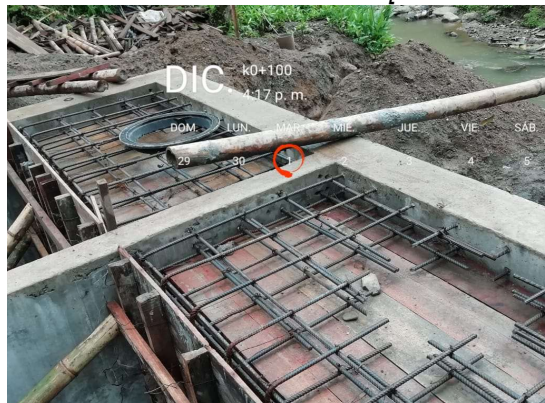
Armado de estructura para tapas tipo manhole [Localización:K0+100]