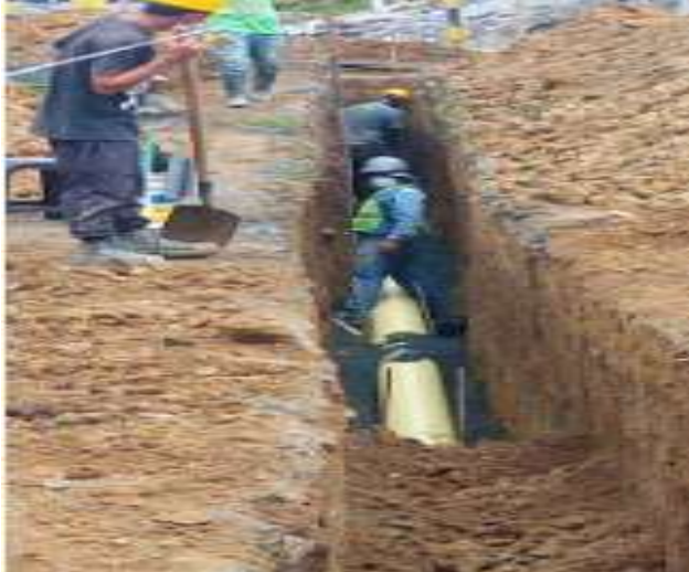
PROCESO DE EXCAVACIÓN E INSTALACIÓN TUBERÍA PVC 10" EXPANSIÓN ZONA LA BADEA