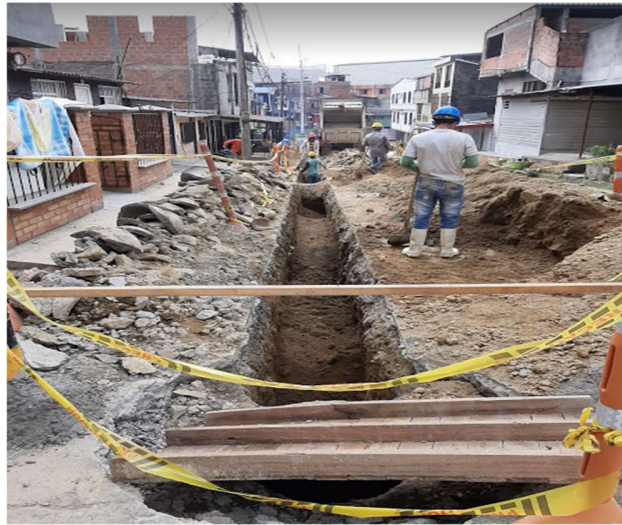
PROCESO DE LLENO CON MATERIAL SELECCIONADO DE LAS EXCAVACIONES TRAMO N° 4 BARRIO LA GRACIELA