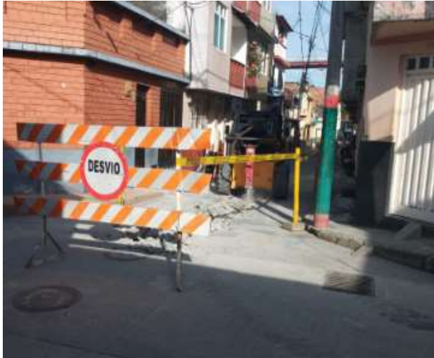
SEÑALIZACIÓN E INICIO DE DEMOLICIÓN DE PAVIMENTOS TRAMO NUEVO N° 4 BARRIO OTÚN