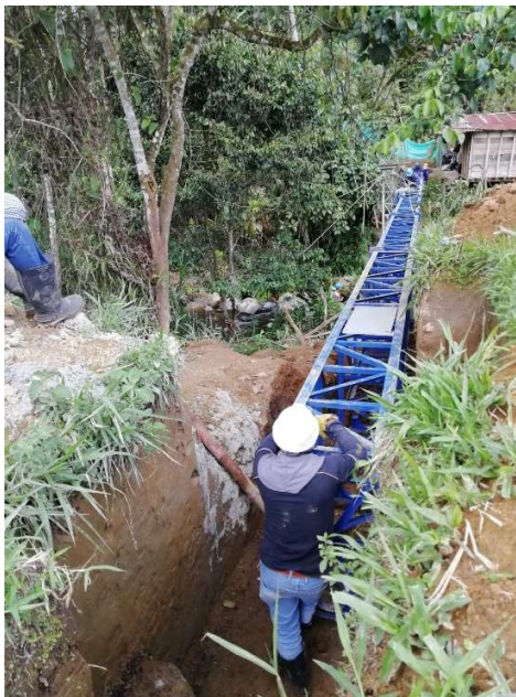
Instalación Viaducto numero 4