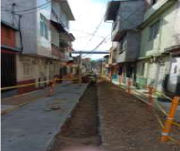
PROCESO DE EXCAVACIÓN TRAMO NUEVO N° 4 BARRIO OTÚN