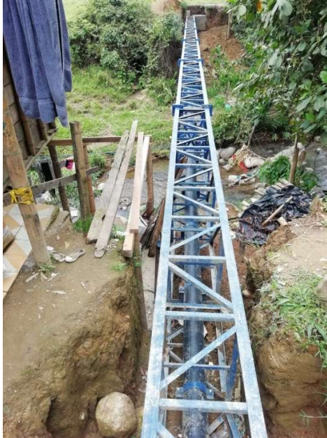
Viaducto Numero 4