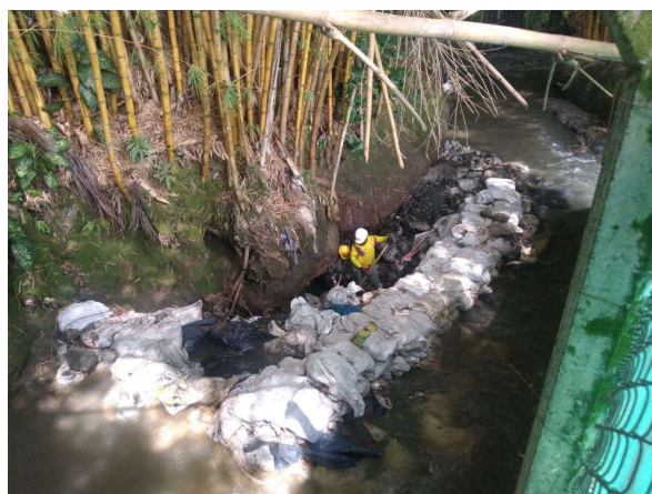
Desvio de Quebrada