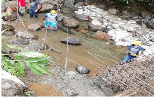
Nivelación del Pozo de amortiguamiento [Localización:K0+010]