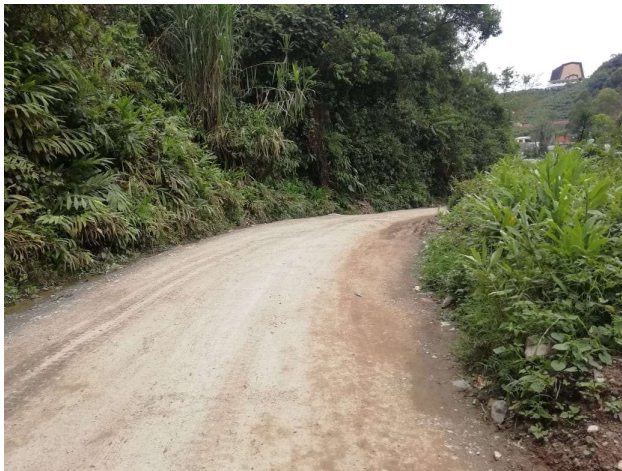
Via Restaurada despues de instalacion de Tuberias.