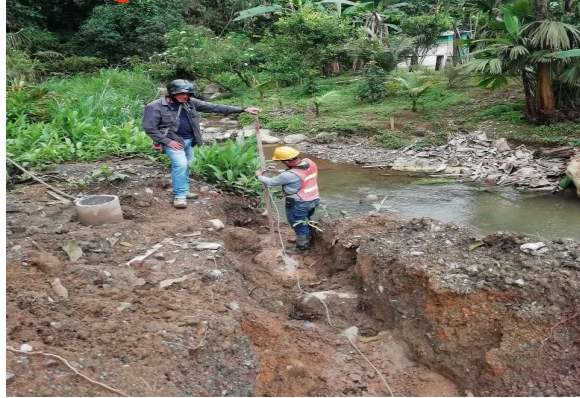
Excavación de descarga del desarenador [Localización:K0+110]