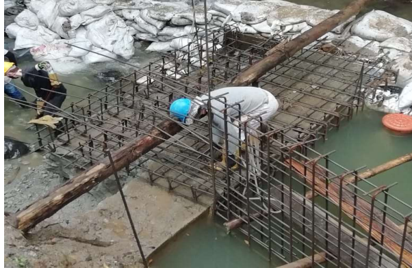
Armado canal de aducción en bocatoma [Localización:K0+000]