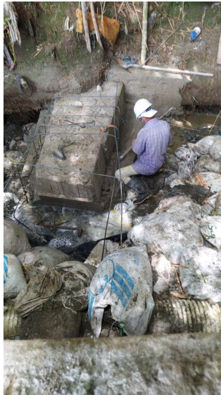
Construcción paso Subfluvial