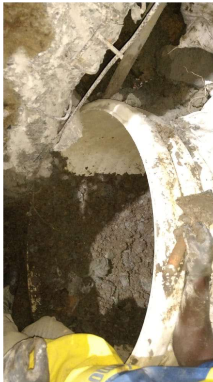
Instalacion Tuberia 42"