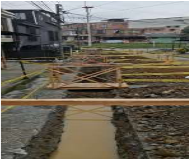
PROCESO DE EXCAVACIÓN TRAMO N° 4 BARRIO LA GRACIELA