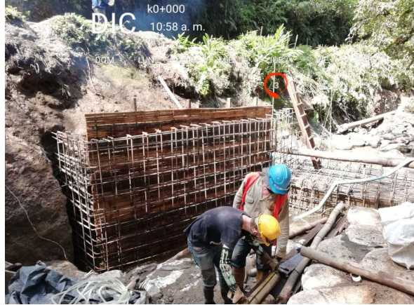
Formaleta en muro de protección de bocatoma [Localización:K0+000]