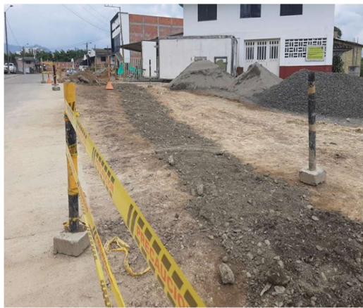
PROCESO DE LLENO CON MATERIAL SELECCIONADO DE LAS EXCAVACIONES EXPANSIÓN ZONA LA BADEA