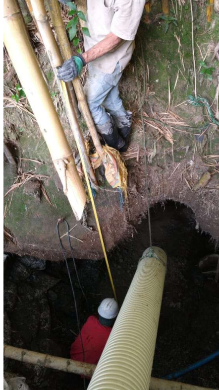
Construcción paso Subfluvial