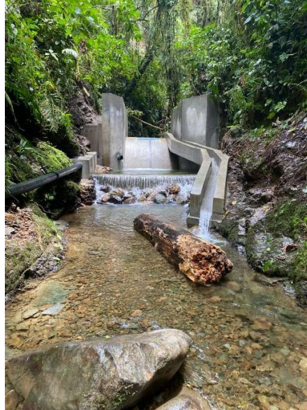
Bocatoma culminada San Joaquín