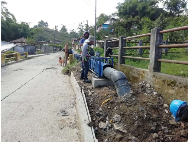
Proceso de instalcion de Proteccion para Tuberia en viaducto