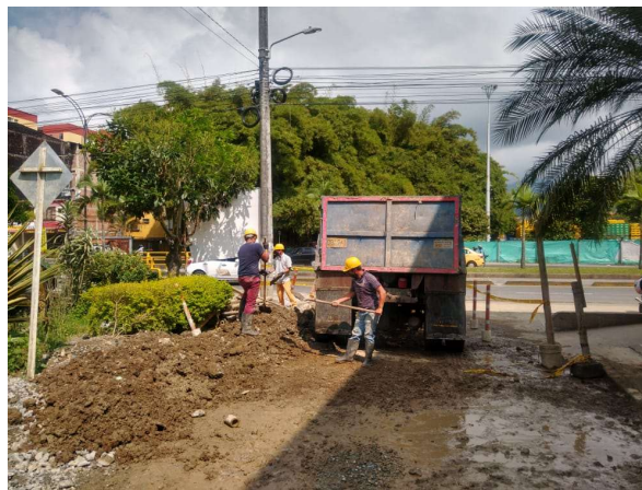
Retiro material Sobrante