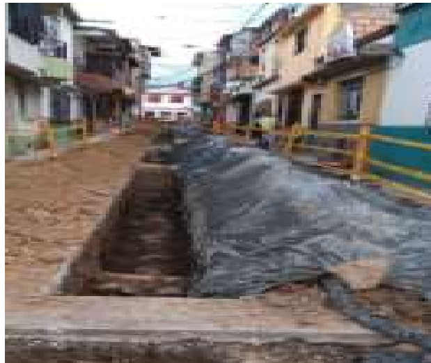
PROCESO DE EXCAVACIÓN TRAMO NUEVO N° 4 BARRIO OTÚN